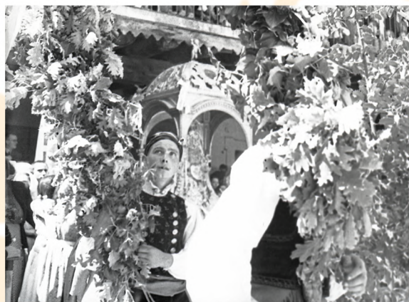
Procesión de la Virgen de la Asunción. La Alberca. José Núñez Larraz